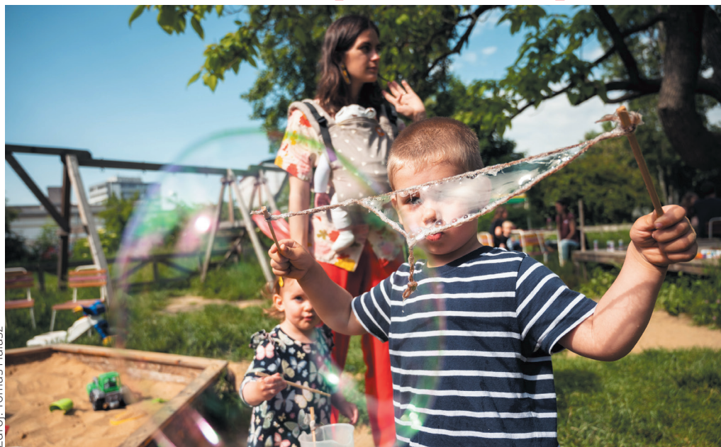
Zdroj: Tomáš Halász